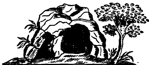
מערת רשב"י בפקיעין